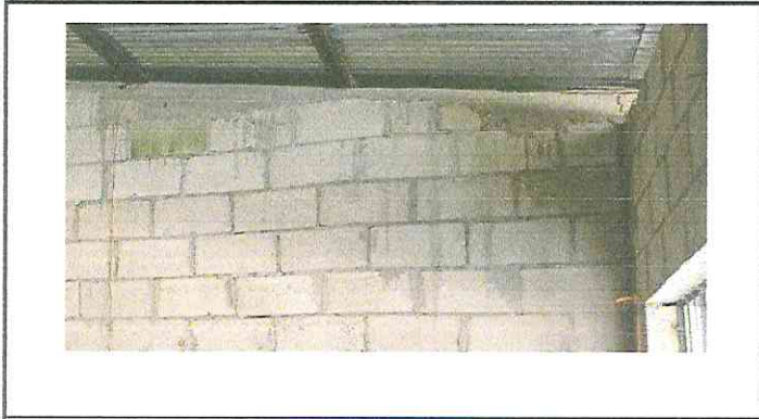
repello de muros interior